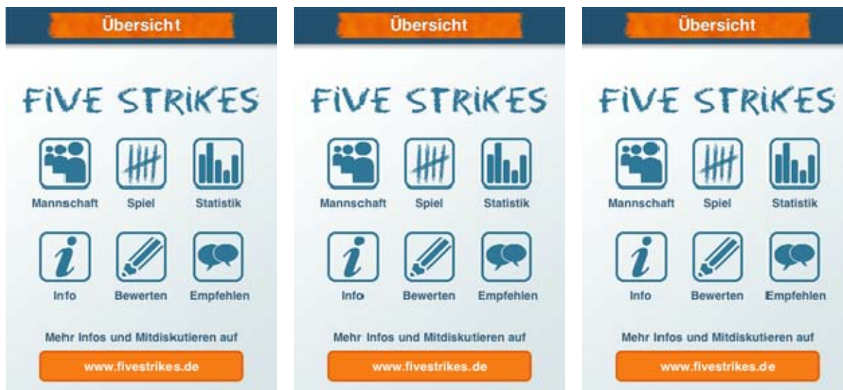
Five Strikes Lite (iPhone)